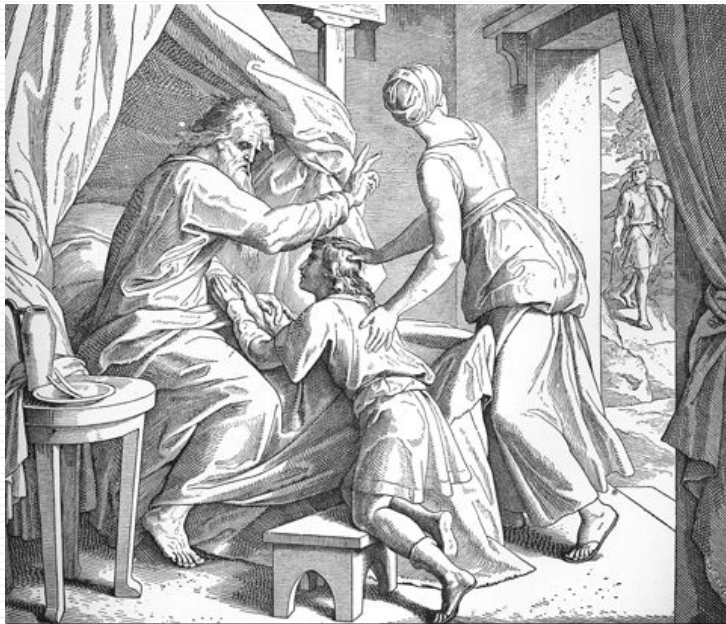
Jakob vor Isaak